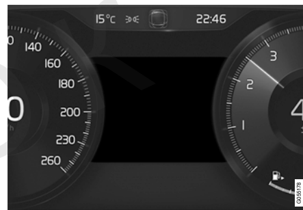
Зона повідомлень на дисплеї водія.